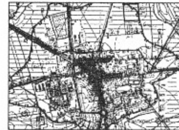
FRAGMENT STUDIUM UWARUNKOWAŃ I KIERUNKÓW ZAGOSPODAROWANIA PRZESTRZENNEGO MIASTA I GMINY WITKOWO - UCHWAŁA NR XXVI/198/97 RADY MIEJSKIEJ W WITKOWIE Z DNIA 22.XI.1997R.